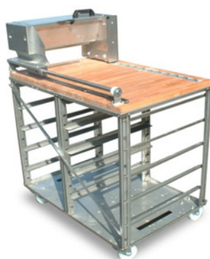
Mesa enharinadora inox con ruedas y sobre de haya