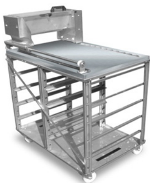
Mesa enharinadora inox con ruedas