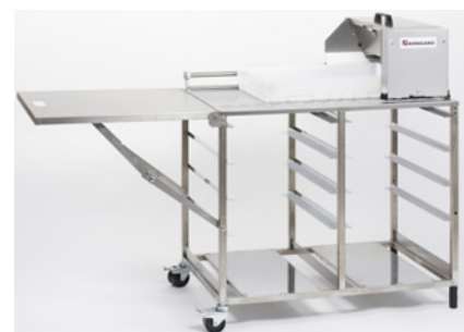
Mesa enharinadora inox con ruedas y ala abatible