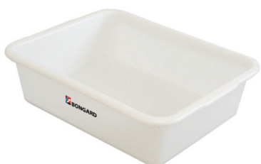
Cubeta de reposo 600x400x145 mm

■ Estándar / Opción / € Opción con coste añadido / ❖ No disponible