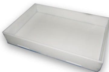
Cubeta de división