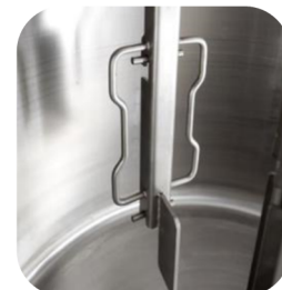
Tanque y útiles interiores en acero INOX.