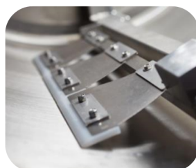
Rascadores PEHD y de silicona