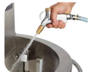
Ducha de lavado incluida